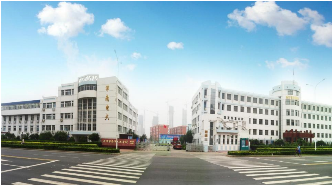
津南区2026年4月自学考试南洋工业学校考场示意图